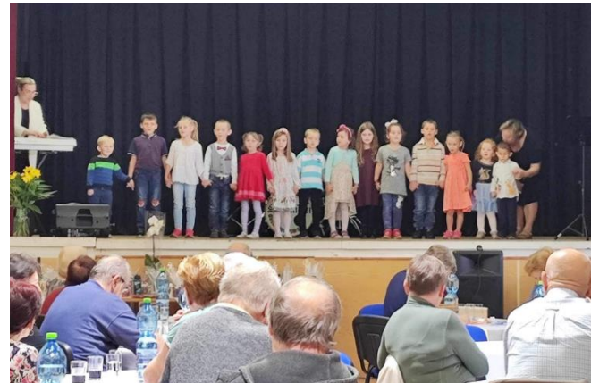
Holky ze školky

Podzim jsme si zpestřili vystoupením na Vítání občánků a na Setkání seniorů. Společné odpoledne s rodiči jsme si užili na Drakiádě s opékáním špekáčků na zahradě MŠ, kterou jsme ještě celý podzim hojně využívali. Kulturně jsme se vyžili na divadelním představení v MŠ Němčice a na promítání pohádky