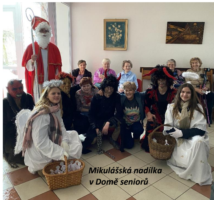
Mikulášská nadílka v Domě seniorů

Pokojné prožití vánočních svátků a do nového roku hlavně hodně zdraví, štěstí a splněných přání přeji zaměstnanci ZŠ Kostelec u Holešova.