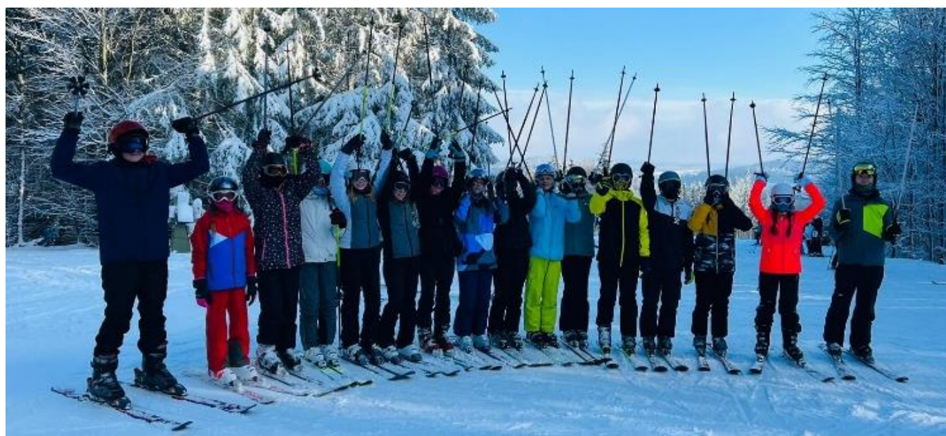
Žáci 8. a 9. třídy na lyžařském výcviku v Karlově.