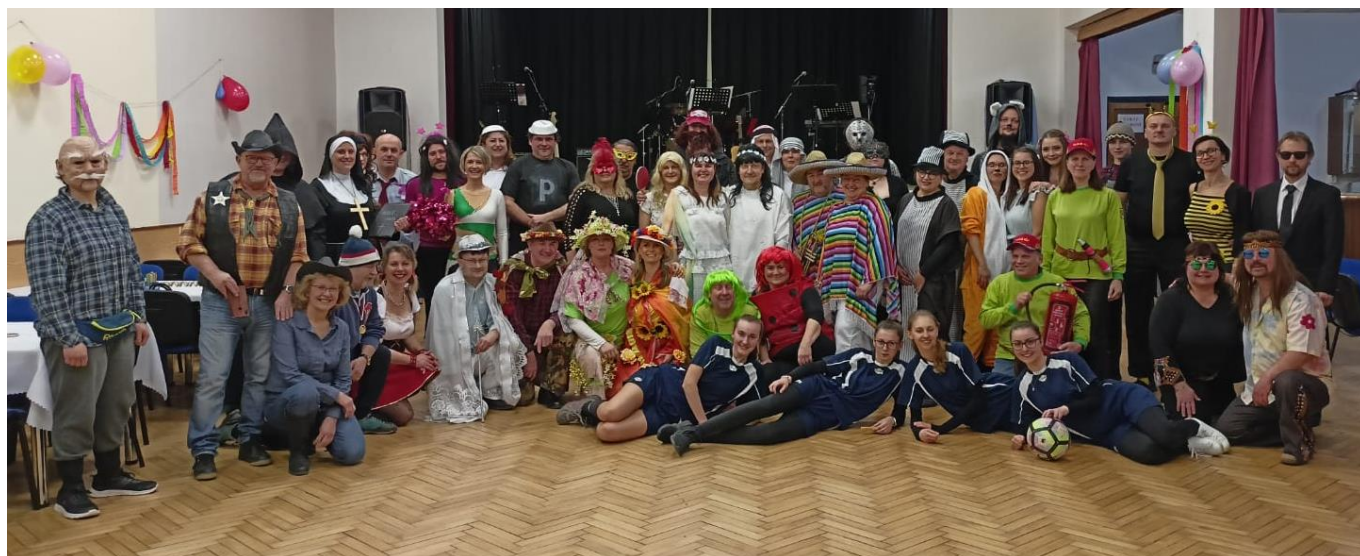
Plesovou sezonu v Kostelci zahájil maškarní bál spolku Kosteláň.

ZPRAVODAJ OBCE KOSTELEC U HOLEŠOVA A KARLOVICE