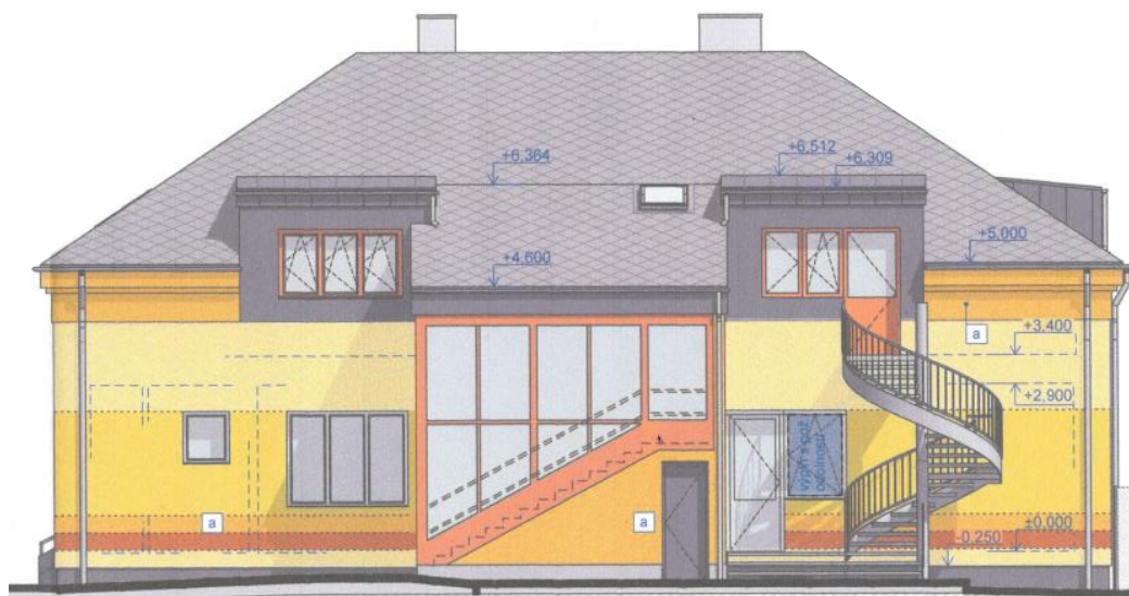
Budova MŠ po rekonstrukci a přestavbě - pohled ze zahrady