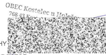
Výpočet odstupových vzdáleností od L.p (SO-01 Rodinný dům)